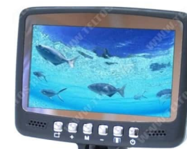
Fishcam plus 700