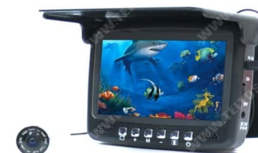
Fishcam plus 750