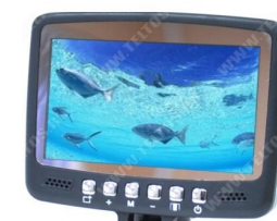
Fishcam plus 700

Компания "Teltos" настоятельно рекомендует прочесть данную инструкцию перед использованием устройства.