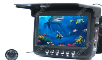
Fishcam plus 750